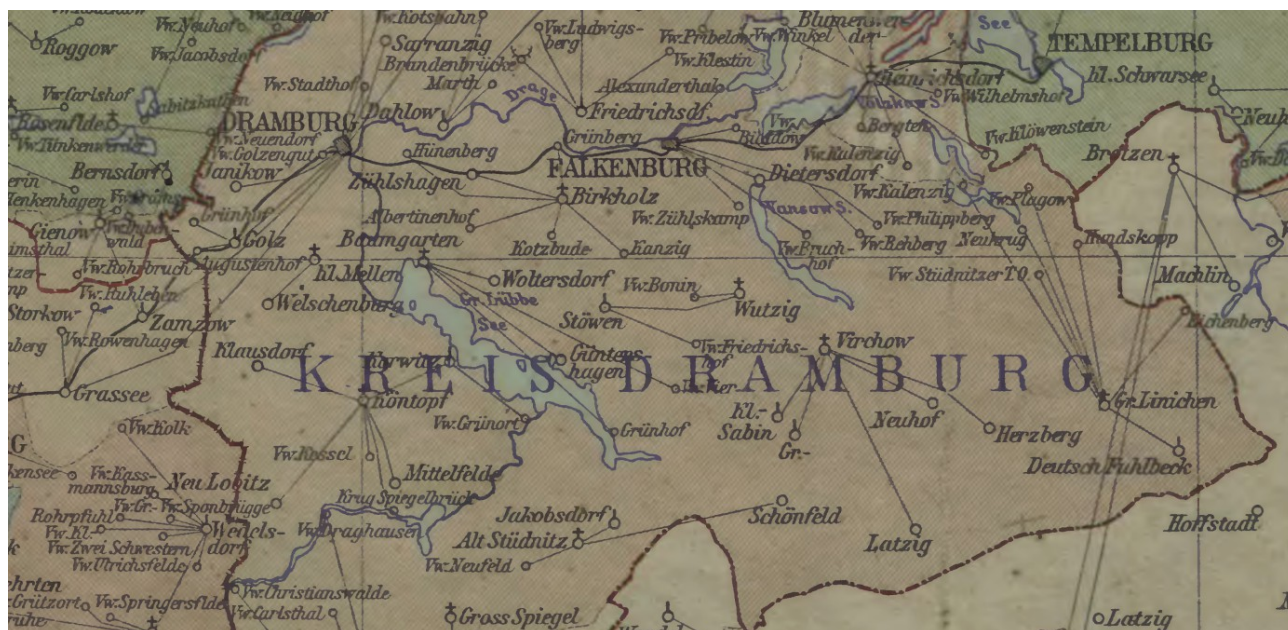
Fragment mapy prowincji Pomorze z pierwszej połowy XIX wieku

Po 1815 roku z dawnej Nowej Marchii wyłączono powiat drawski i przyłączono do prowincji Pomorze. W skład tej prowincji wchodziły rejencje; koszalińska i szczecińska (od 1818 roku także strzałowska). Rejencja koszalińska rozpoczęła działalność w 1816 roku. W jej skład weszło 10 powiatów, w tym także powiat drawski z okolicami współczesnej gminy.