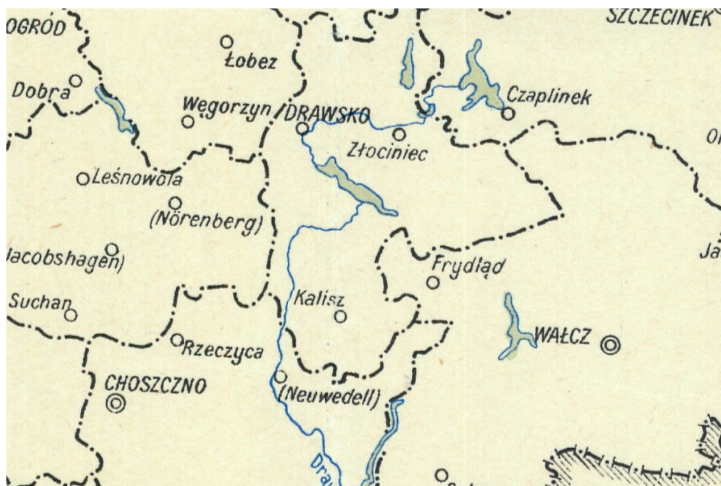
Podział na powiaty w 1946 roku

W 1946 roku nastąpiło scalenie obszarów Ziem Odzyskanych z resztą kraju. Utworzono nowe województwa (wrocławskie, olsztyńskie i szczecińskie), część obszarów włączono do dotychczasowych województw; poznańskiego, białostockiego, śląskiego i gdańskiego. Rozporządzenie weszło w życie 28 czerwca 1946 roku. Powiat drawski, wraz z gminą Wierzchowo, został włączony do województwa szczecińskiego. Przynależność do tegoż województwa trwała do 1950 roku. 27