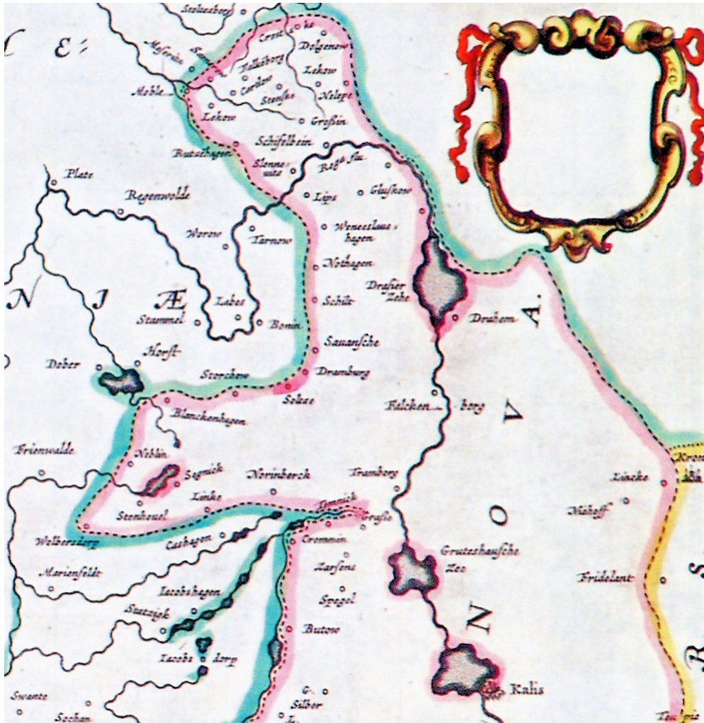
Fragment mapy Nowej Marchii z 1662 roku

Od 1618 roku Brandenburgia (której jedną z prowincji była Nowa Marchia) i Prusy Wschodnie stały się jednym państwem pod władzą tego samego władcy (unia personalna). Książęta Prus Wschodnich zdołali się uniezależnić od Rzeczypospolitej (1657). Miarą wzrostu znaczenia była koronacja księcia Fryderyka III na króla Prus w 1701 roku.