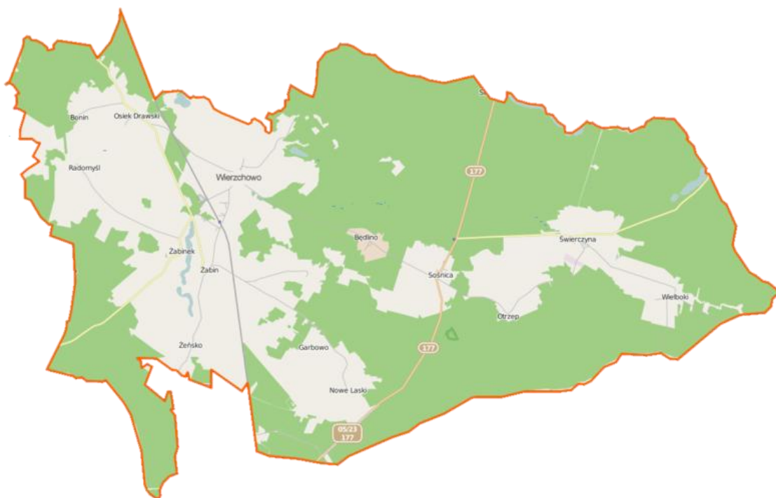
Rysunek 1. Mapa gminy Wierzchowo.

Gmina Wierzchowo jest gminą wiejską o charakterze rolniczym z dużą rolą przemysłu leśno-drzewnego, zamieszkiwaną przez 4473 mieszkańców. Siedzibą Gminy jest Wierzchowo,