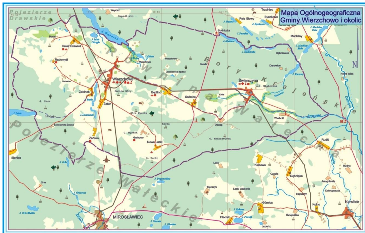
Rysunek 2. Mapa ogólnogeograficzna Gminy Wierzchowo i okolic