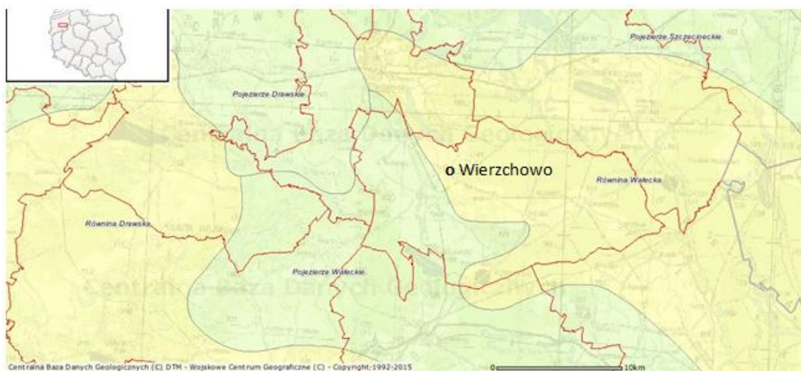
Rysunek 3. Położenie gminy Wierzchowo na tle jednostek fizyczno-geograficznych.

Pojezierze Drawskie - mezoregion fizycznogeograficzny w środkowej części Pojezierza Zachodniopomorskiego, między Drawskim Pomorskim i jeziorem Lubie na południowym-zachodzie a środkowym biegiem Radwi na północnym-wschodzie. Jest to jeden z największych kompleksów jeziornych w Polsce. Znajduje się w północno-zachodniej Polsce i należy do Pojezierza Zachodniopomorskiego. Liczy sobie ono ok. 250 jezior o różnej wielkości, przy czym większość to jeziora typu rynnowego. Poza tym, występują tu liczne bagna, torfowiska, jary.